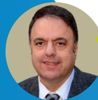
VALENTÍ JUNYENT I TORRAS Alcalde de Manresa

Trabajo, profesionalidad y humanidad, un extraordinario tesoro