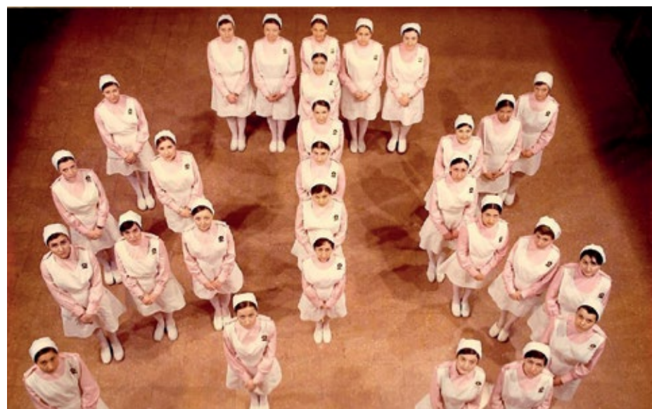
Tercera promoció de l'escola d'Infermeria de Manresa, als anys 70

Mitjançant el treball en xarxa, Althaia ofereix serveis especialitzats a centres sanitaris de les comarques centrals i la Cerdanya, i alhora en rep d'altres per mitjà d'acords amb altres institucions de Barcelona i de l'àrea metropolitana.