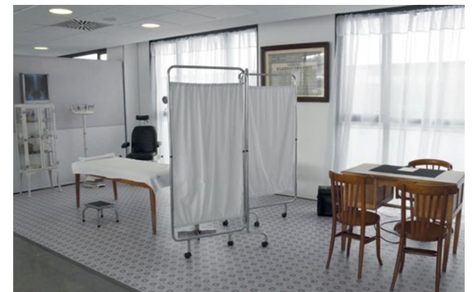
Amb motiu de l'exposició s'ha recreat un consultori mèdic de mitjan segle XX

3 Més de 500 escolars han fet una visita guiada a l'exposició