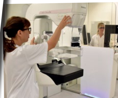
Donació d'un nou mamògraf