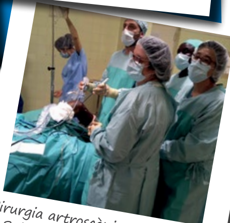
Cirurgia artroscòpica a l'hospital Saint Jean de Dieu de Thiès