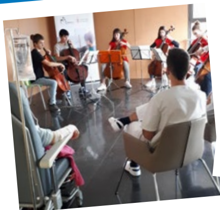
Música en vena