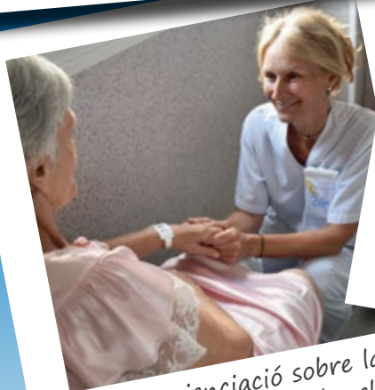
Conscienciació sobre la importància de controlar el dolor