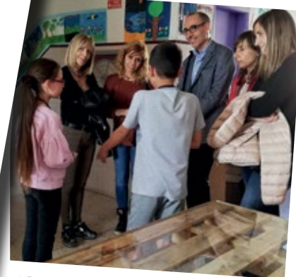
'Partners' amb l'escola Sant Ignasi en el programa Magnet