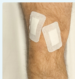
3. Col·loqueu apòsits nets