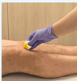
2. Netegeu la ferida amb clorhexidina a l'1%